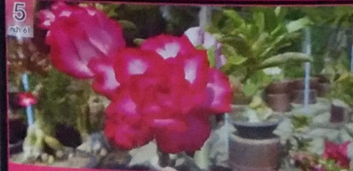
โพลีซูฟาร์มครบเครื่องเรื่อง“แม่พันธุ์”ชวนชม