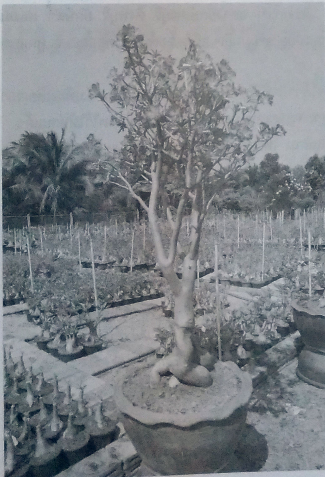
ต้นแม่พันธุ์ดอกดก พร้อมผลิตเมล็ด

ในฐานะสวนและฮับ รับซื้อ-จำหน่ายเมล็ดพันธุ์ชวนชมรายใหญ่ เจ้าของพูดถึงการทำตลาดในโลกไร้พรมแดนว่า