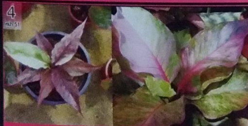
หน้าวัวในทรงดอกกุหลาบ สีสันสวยงาม