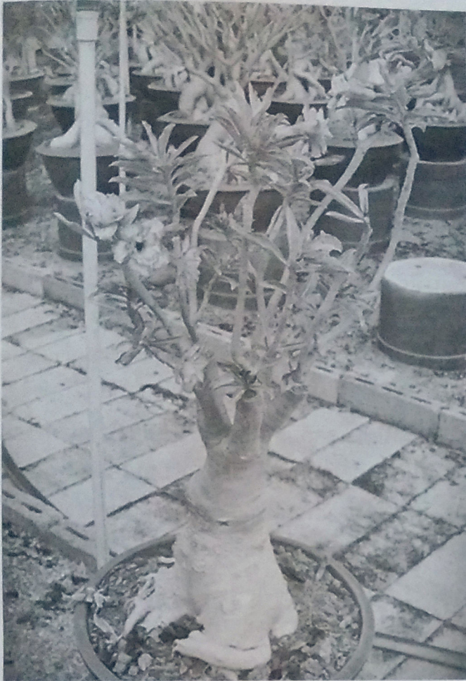
ชวนชมยักษ์ญี่ปุ่นแคระ